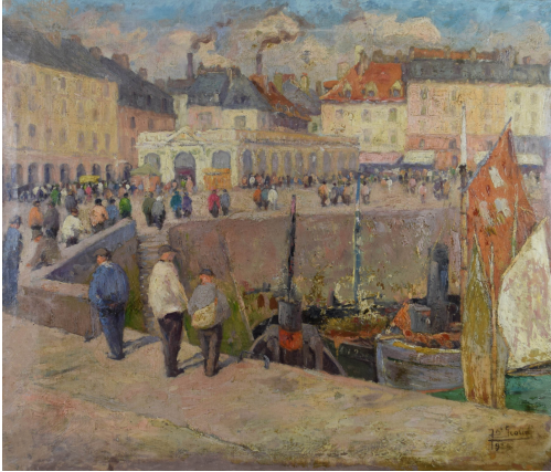
Tableau - "Le port de Dieppe"