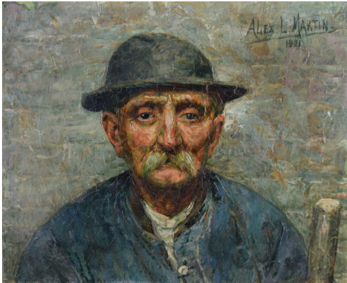
Tableau - "Le mineur"