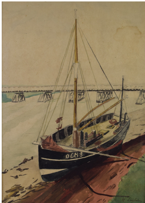
Tableau - "L'estuaire "