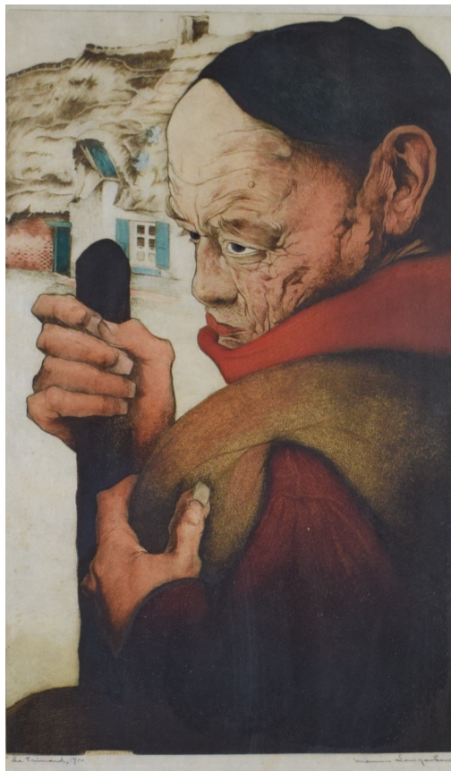
Tableau - "Le trimard"