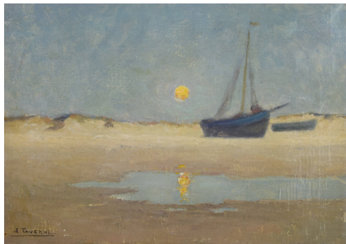
Tableau - "LevÃ© de lune Ã Heist"