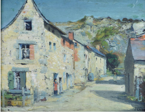
Tableau - "La rue du village animé" © "