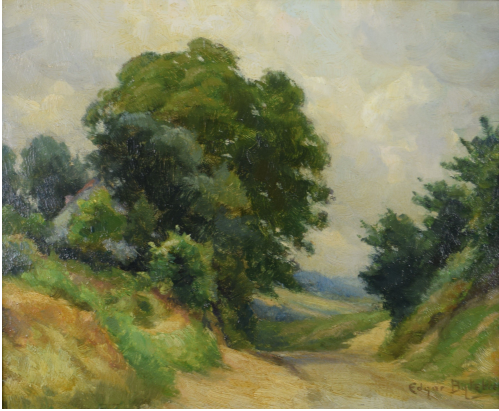
Tableau - "Chemin Creux À Dilbeek "