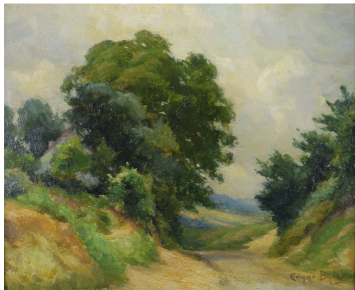
Tableau - "Chemin Creux À Dilbeek "