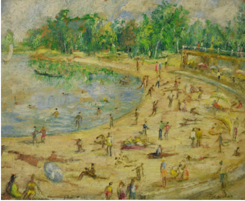
Tableau - "Journé sur le sable"