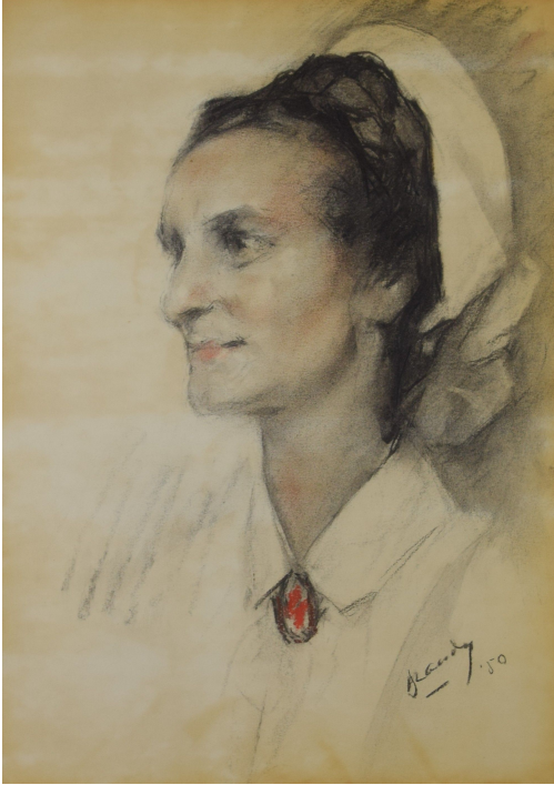
Tableau - "L'infirmiÃ¨re "