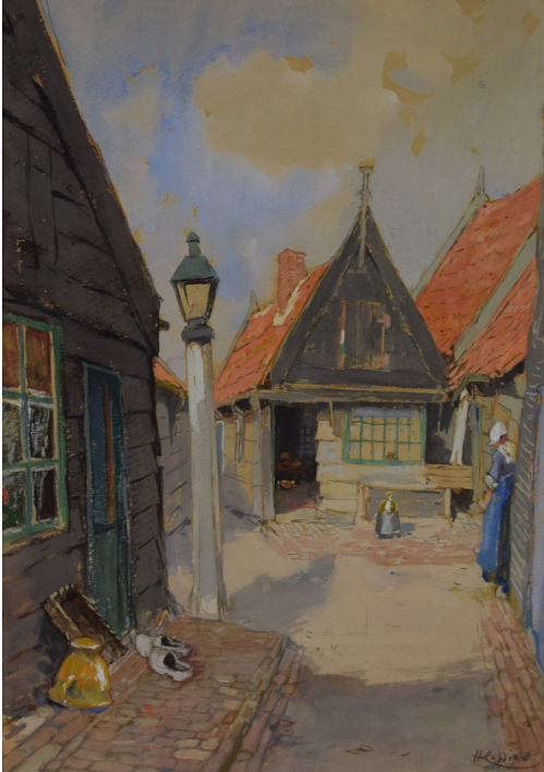
Tableau - "Le village"