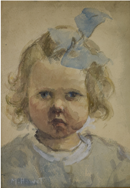
Tableau - "La petite fille au noeud"