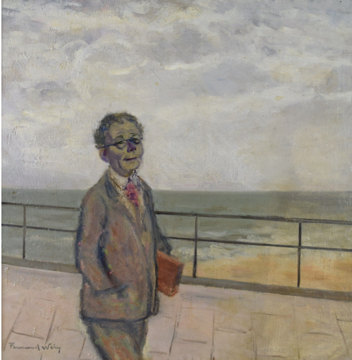
Tableau - "Le peintre À la mer"