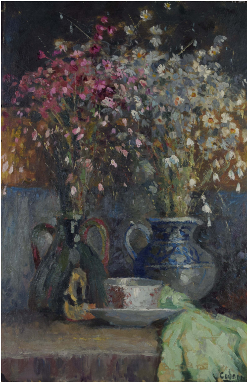
Tableau - "Le bouquet printanier "