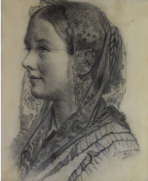
Tableau - "La femme À la dentelle "