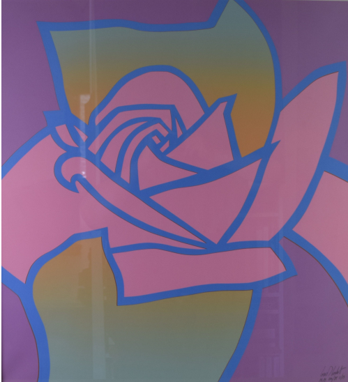
Tableau - "La rose"