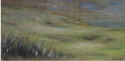
Tableau - "La mer du nord"