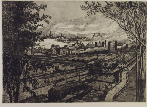
Tableau - "La vallée de la Meuse"