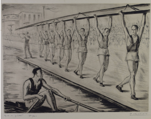
Tableau - "Huit de Pointe"