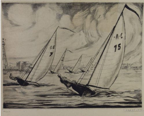
Tableau - "Yacht Racing at the Berlin 1936"