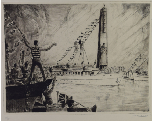
Tableau - "Canal Albert"