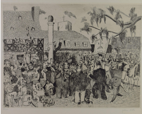
Tableau - "Kermesse à Liège"