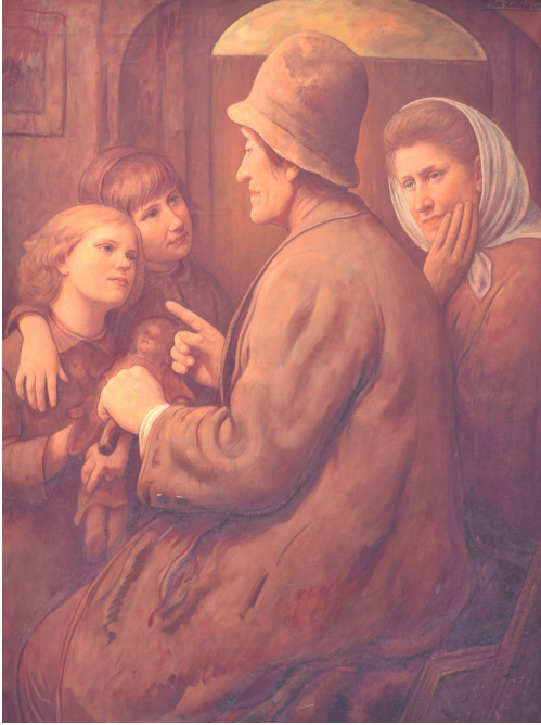
Tableau - "Les conseils de l'aïeul "