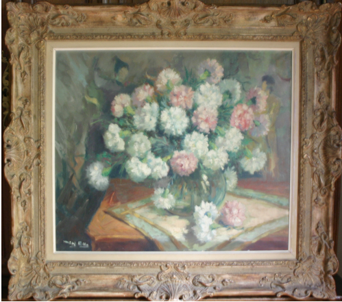
Tableau - "Le bouquet"