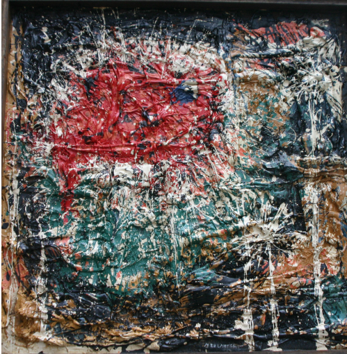
Tableau - "Abstrait"