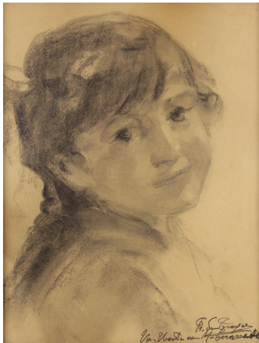
Tableau - "l'enfant"