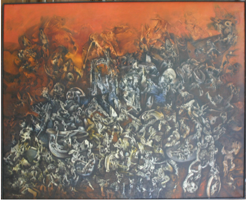
Tableau - "Les Sonnels grigous"