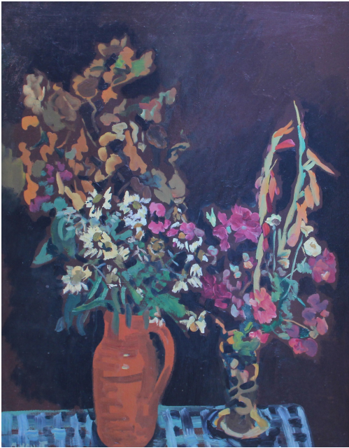
Tableau - "Le bouquet"