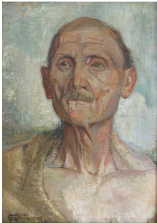
Tableau - "Le veillard"