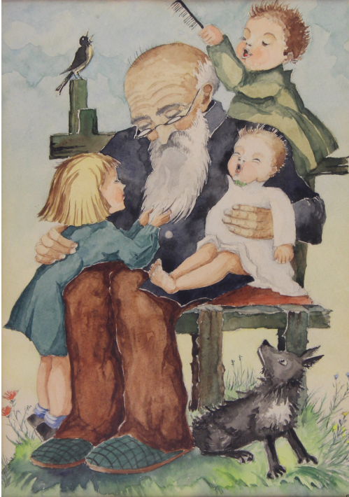
Tableau - "La famille"