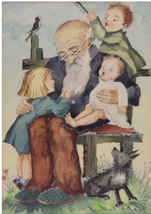
Tableau - "La famille"